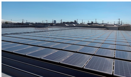
施設屋根を有効活用して再エネを地域に巡らせる

小売や物流施設などの屋根を活用したオンサイトPPAによる自家消費型太陽光事業を子会社のVPP Japanを通じて開始。現在、FIT制度を利用しない分散型太陽光発電所としては国内最大級となる全国396施設/82,670kW(2022年8月18日時点)を保有。これらの発電所を当社独自のAI予測技術を用いたデジタルプラットフォームで一括管理。施設で消費しきれない余った電力を他電力利用者への供給や蓄電池に融通するなど「再エネの余剰電力循環モデル」を開始。このモデルにより、電力使用量が少なく屋根の一部分しか太陽光パネルを設置できなかった施設(ホームセンター、物流施設等)でも、最大限に設置する事が可能になった。自然を傷つけずに再エネの地域循環や利用率の最大化を推進している。