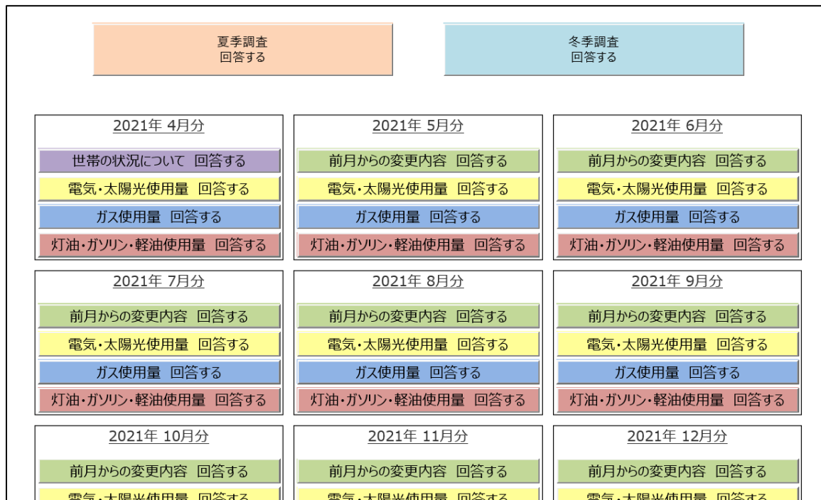
図 2.1.1 燃料種選択画面

なお、調査員調査でもオンライン回答画面を作成しており、同様の画面構成としている。