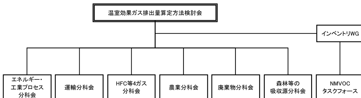
図 A 6-1 温室効果ガス排出量算定方法検討会の体制

インベントリ WG、各分科会及びタスクフォースは、各分野の専門家より構成され、インベントリ改善に関する案を検討する。改善案は、温室効果ガス排出量算定方法検討会において再度検討され、承認される。