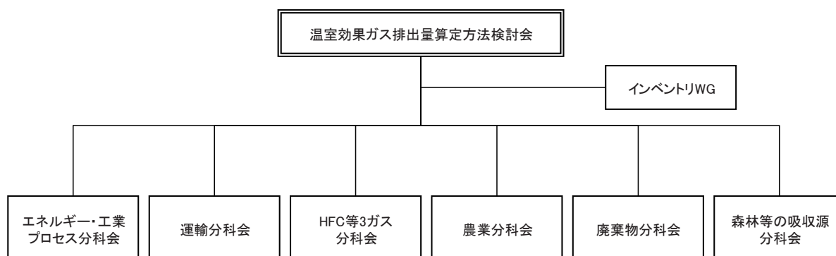
図 A 6-1 温室効果ガス排出量算定方法検討会の体制

インベントリWG及び各分科会は、各分野の専門家より構成され、インベントリ改善に関する案を検討する。改善案は、温室効果ガス排出量算定方法検討会において再度検討され、承認される。