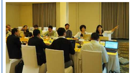
↑ 分野毎の相互学習風景(小グループ)