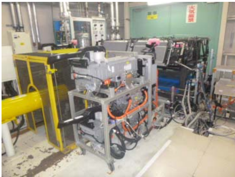
台上試験設備外観