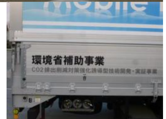
70MPa移動式水素ステーション導入