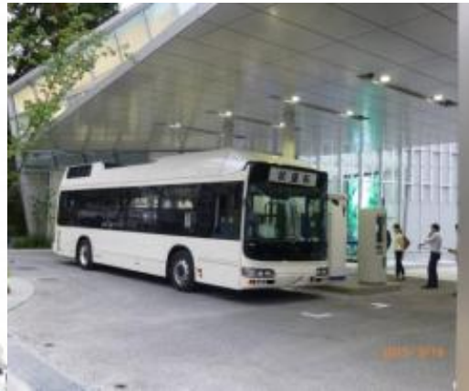
燃料電池バス都内実路走行