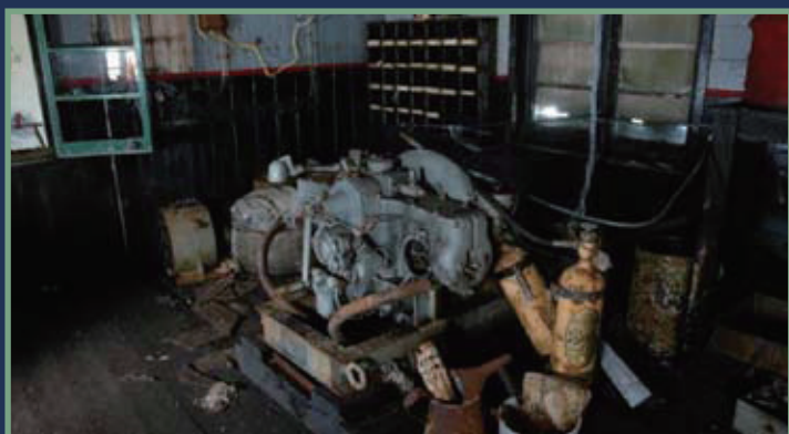
発電機小屋に設置されたままの発電機