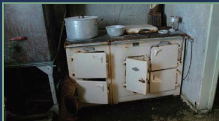
調理場のAGA調理器具