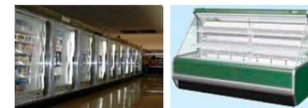
<冷凍冷蔵ショーケース>

お問合せ先： 環境省 地球環境局 地球温暖化対策課 フロン対策室 電話：03-5521-8329