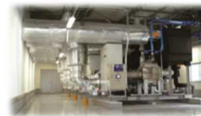
<中央方式冷凍冷蔵機器>

フロン類ではなく、アンモニア、二酸化炭素、空気等、自然界に存在する物質を冷媒として使用した冷凍冷蔵機器であって、同等の能力を有するフロン類を冷媒として使用した機器と比較してエネルギー起源二酸化炭素の排出が少ないもの