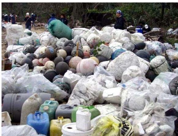
図 1.1-1 ユチン海岸の清掃（平成20年3月1日）で回収された漂着ゴミ （情報提供：西表島エコツーリズム協会）