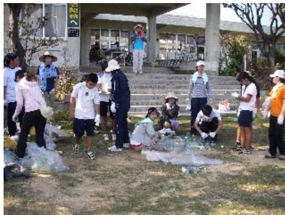
図 1.1-4 鳩間小中学校における環境教育による海岸清掃の様子（2008年9月18日）

西表エコプロジェクト及び西表島エコツーリズム協会では、回収したゴミの運搬処理費用の支出には限界があるという事情も踏まえ、環境教育を行う上では回収作業は必ずしも必要ではなく、海岸に漂着したゴミを観察する方法も有効であると考えている。（情報提供：西表島エコツーリズム協会・西表エコプロジェクト）