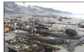
海岸漂着ゴミや流木等の状況