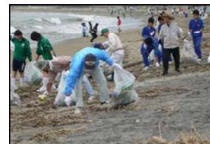
NPO等による海岸清掃