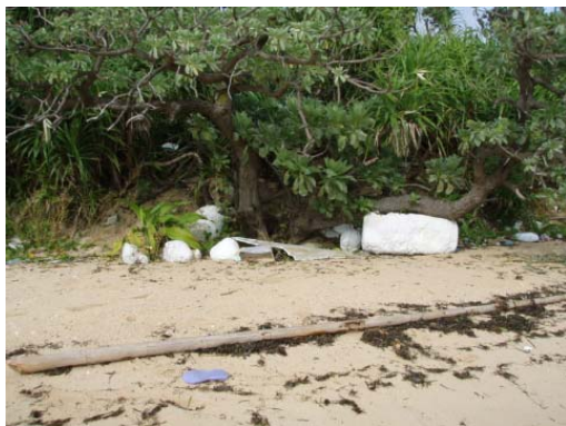
調査地点 3 ~ 4 の植生