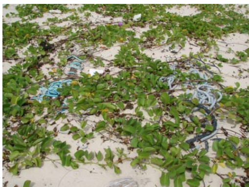
調査地点 5 ~ 6 の植生