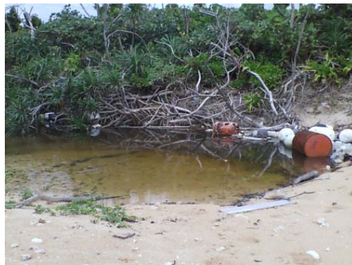
調査地点 1 西の流れ込み