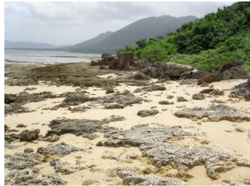
調査地点 4 ~ 5 (岩場)