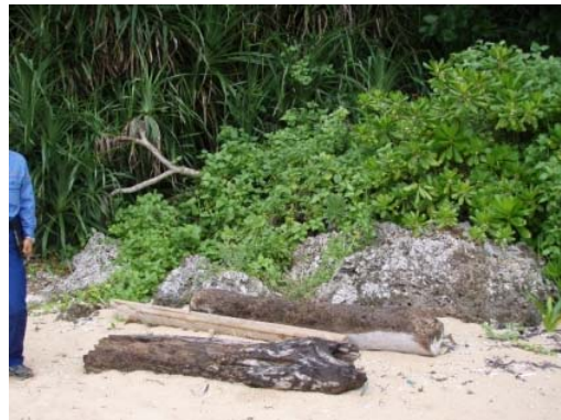
調査地点 4 付近の流木