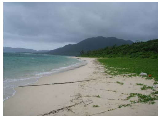
調査地点 5 ~ 6