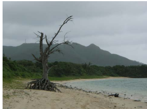
調査地点 4 ~ 5