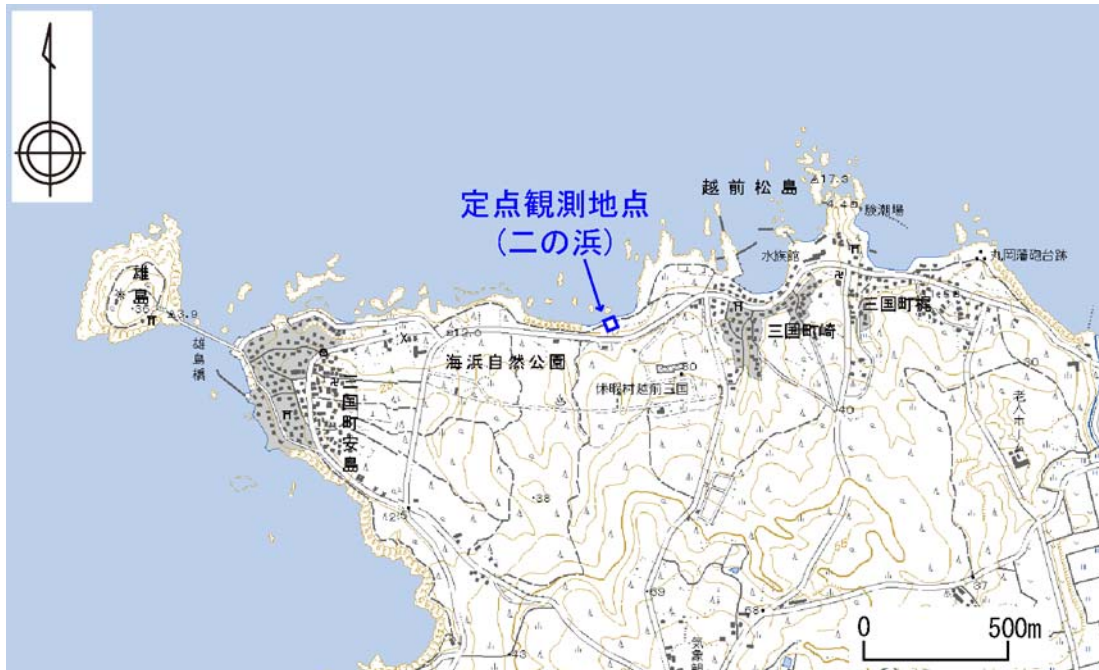
図 1 二の浜海岸定点撮影地点