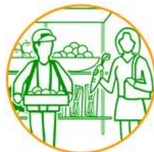
地元食材を使って 地産地消