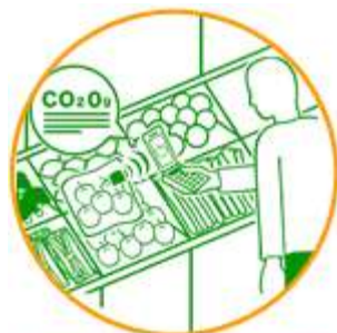
カーボン・フットプリントで 商品を選択