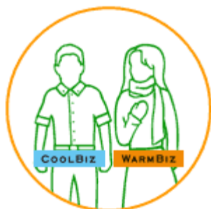
クールビズや ウォームビズの実践