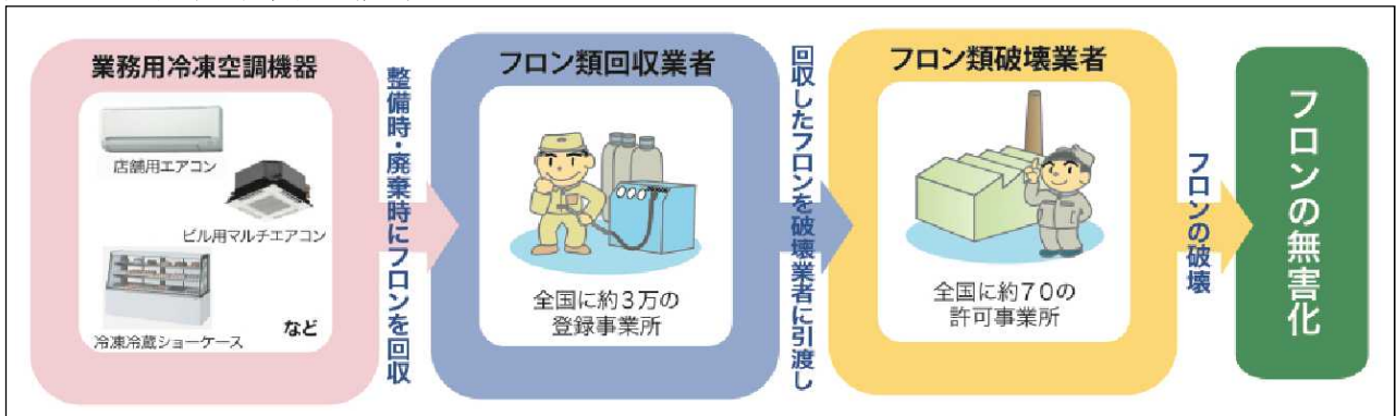
図 1 フロン回収・破壊法の概要

しかし、冷凍空調機器用の冷媒として使用されるHFCが急増しており、さらに、経済産業省の調査(経済産業省が把握するフロン使用製品約 26 万サンプルが対象)により、業務用冷凍空調機器の廃棄時の漏えいと同程度の機器使用中の漏えいが判明した。