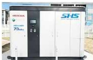
水素ステーション