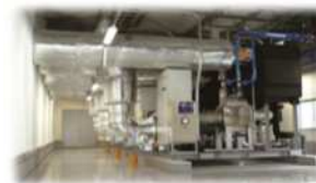
<中央方式冷凍冷蔵機器>

フロン類ではなく、アンモニア、二酸化炭素、空気等、自然界に存在する物質を冷媒として使用した冷凍冷蔵機器であって、同等の能力を有するフロン類を冷媒として使用した機器と比較してエネルギー起源二酸化炭素の排出が少ないもの