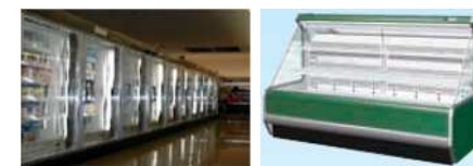
<冷凍冷蔵ショーケース>

お問合せ先： 環境省 地球環境局 地球温暖化対策課 フロン対策室 電話：0570-028-341