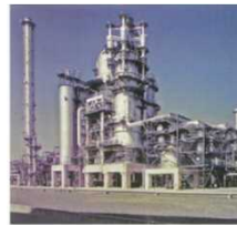
<石油精製所を活用したリサイクル設備>