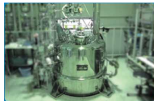
<バイオマスプラスチック製造設備>