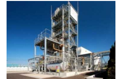
有害化学物質の放出を抑制可能な二酸化炭素分離回収設備