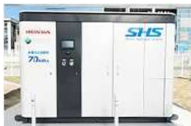
水素ステーション