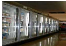
＜冷凍冷蔵ショーケース＞