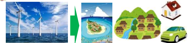
事業化導入計画の策定等