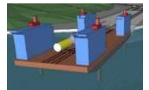
浮体の効率的な施工