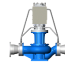
マイクロ水力発電