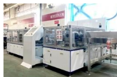
太陽光パネルリサイクル設備