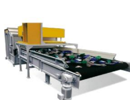
廃プラの選別設備