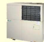
コジェネ レーション