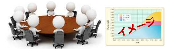
浮体式洋上風車に係る地域コンソーシアム