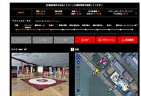
ドローン物流システム