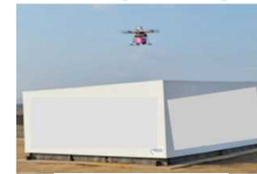
宅配ロッカー型 ドローンポート