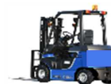
燃料電池 フォークリフト