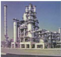
<石油精製所を活用したリサイクル設備>