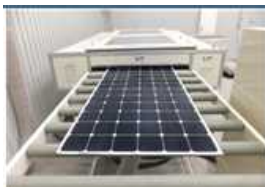
<太陽光発電設備リサイクル設備>