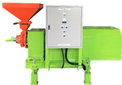
籾殻固形燃料製造装置