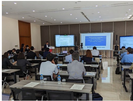
脱炭素促進 現地ワークショップ