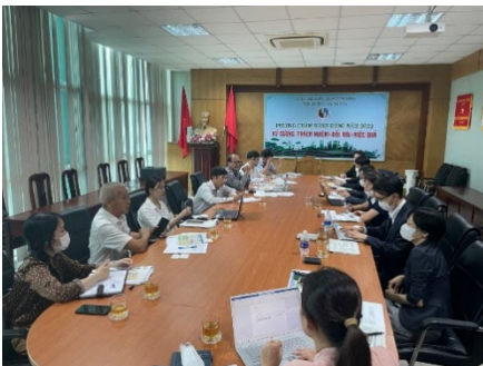
バリアブントウ省 天然資源環境局との会議