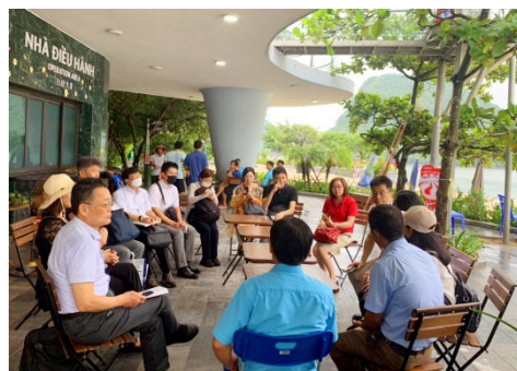
浄化槽試験運用地点訪問 (地元プレス写真)