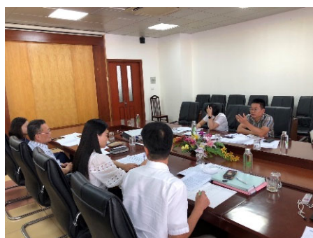
クアンニン省との会議