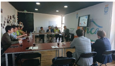
レンカ区協議の様子