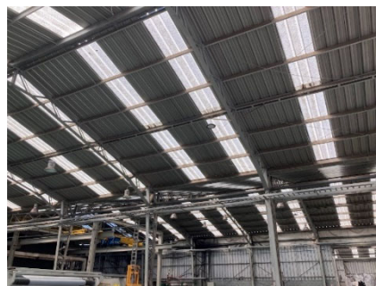
2.0MW太陽光発電システムの 導入予定箇所 (レンカ区プラスチック工場屋根)