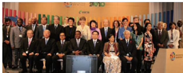
IPSI発足式典(創設メンバーの紹介)