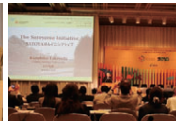
IPSI発足式典(国連大学による発表)