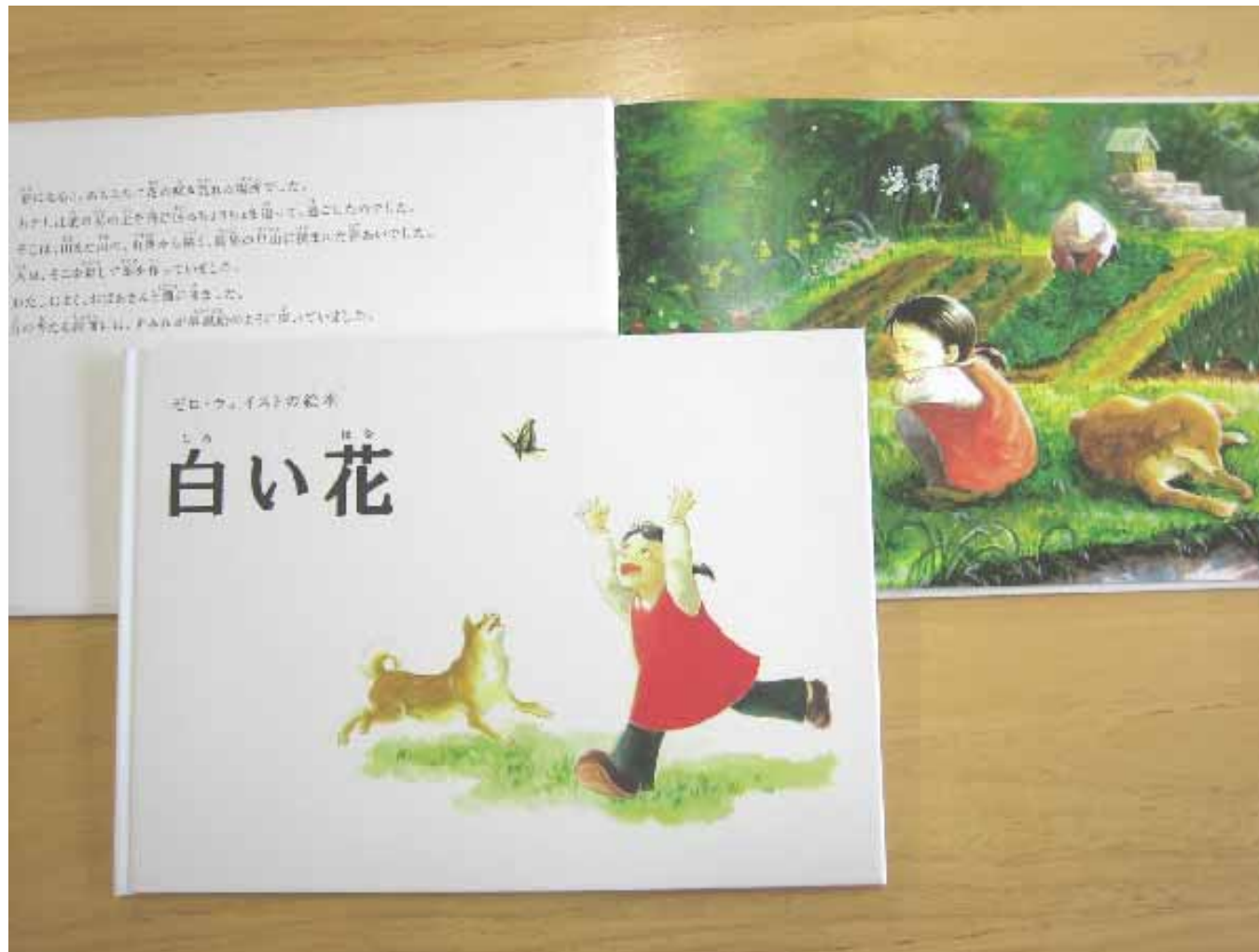
原作を公募した、ゼロ・ウェイストの絵本『白い花』