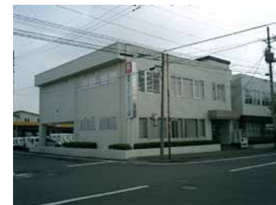
本 社 外 観