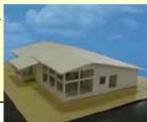
エコクラブハウス