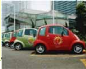
カーシェアリング