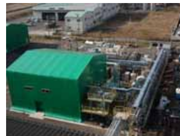
バイオエタノール