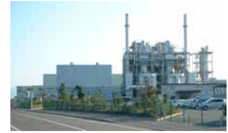
複合中核施設(廃棄物発電)