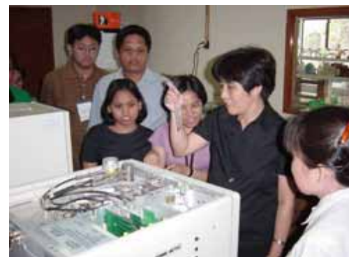
モニタリングの 指導 (フィリピン・ セブ市)