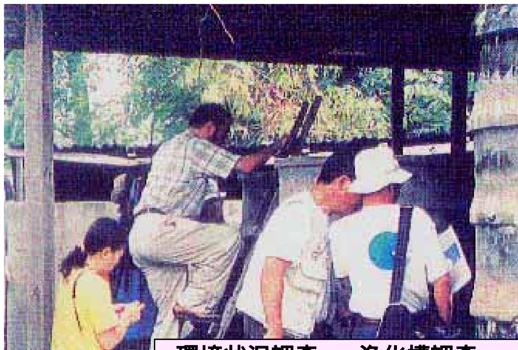
環境状況調査 ~浄化槽調査~