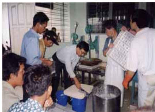
豆腐工場での 技術指導 (インドネシア・ スマラン市)