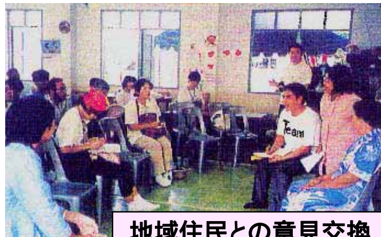
地域住民との意見交換