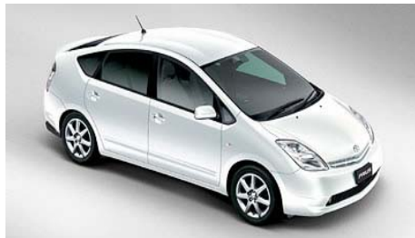
ハイブリッド自動車