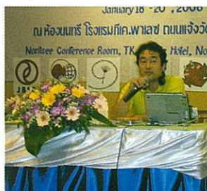
地域と大学の連携報告