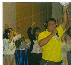
ネットワーク設立を喜びあう