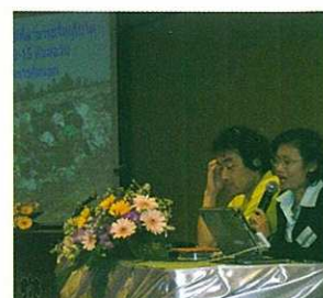
ワリンチャムラの報告

本調査活動を通じて構築したタイの地域環境活動の情報交流ネットワークを維持、拡大するため、ウェブサイト立ち上げた。調査概要をはじめ、セミナーに参加した団体の地域情報や堆肥化マニュアルが掲載されている。