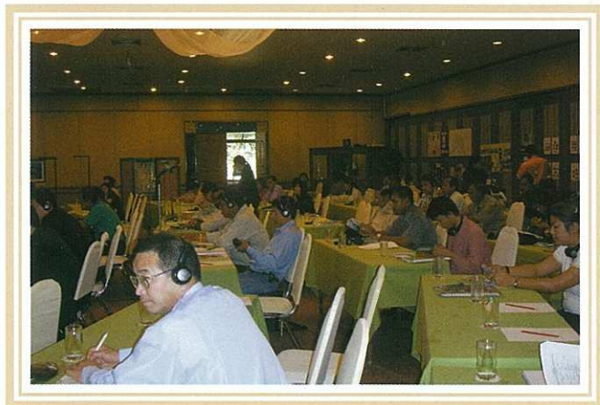
1月のネットワーク設立セミナー

2006年1月の最終セミナーは、タイ地域環境活動ネットワークづくりに関心を寄せる47コミュニティ、53組織の参加者に恵まれた。タイ地域環境活動のポテンシャルの高さと、情報共有ネットワークづくりへの期待の強さを確認する機会となり、ネットワーク設立を喜び合うと共に、継続について3分科会に分かれて検討。ネットワーク設立後の展開についても意見交換した。