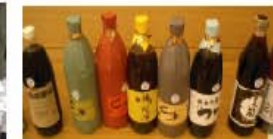
リユースマークの貼ら れたリユースびん