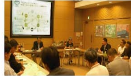
京都方式のリユースマーク 表示びんの発表会