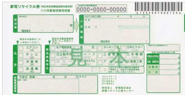
家電リサイクル券(料金販売店回収方式)

小売業者へ対象機器の廃棄物を引き渡す場合、排出者は小売業者へリサイクル料金を支払い、小売業者が発行する管理票(家電リサイクル券)の写しを受け取ります。