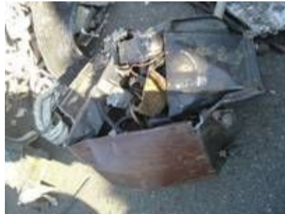
(他の貨物に混入して輸出を図った基板)(中古利用目的と称したエアコン室外機)