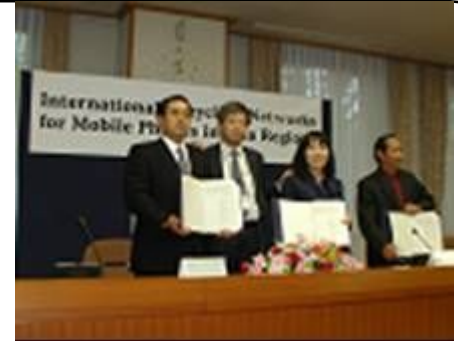
DOWAエコシステム(株)、バーゼル条約事務局、同事務局インドネシア3者の調印式(2006年11月)