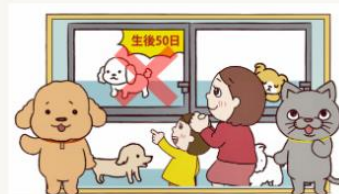
STOP! 生後56日までの犬猫販売～ペットショップ編～