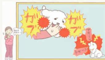
STOP! 生後56日までの犬猫販売～飼い主お悩み編～