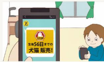
STOP! 生後56日までの犬猫販売～AIにきいてみた編～