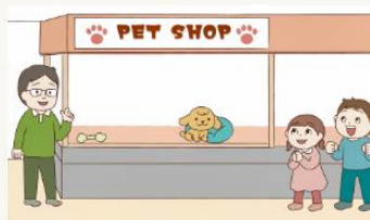
STOP! 生後56日までの犬猫販売～親子でペットショップ編～