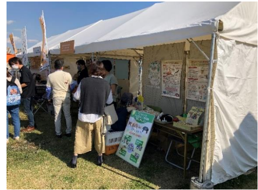
ぼうさいこくたい出展の様子