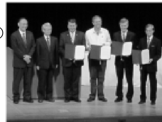
第1回アジア国立公園会議の成果を 第6回世界国立公園会議主催者に受け渡し

※世界国立公園会議は、IUCNが1962年以降概ね10年ごとに開催している、国立公園などに関する国際会議。2014年11月にシドニーにおいて第6回世界国立公園会議が開催される。