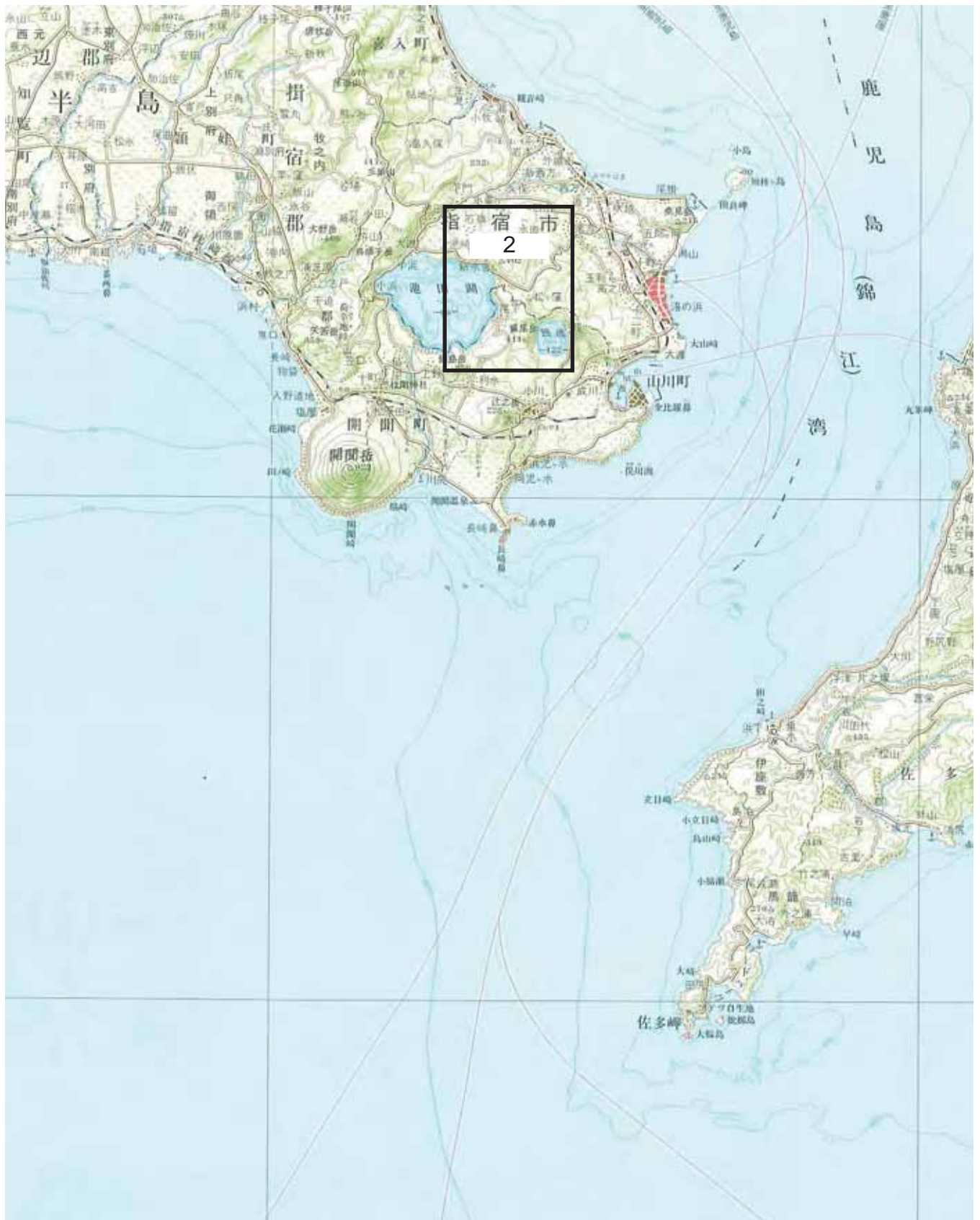
霧島屋久国立公園（錦江湾地域）施設計画変更位置図 2