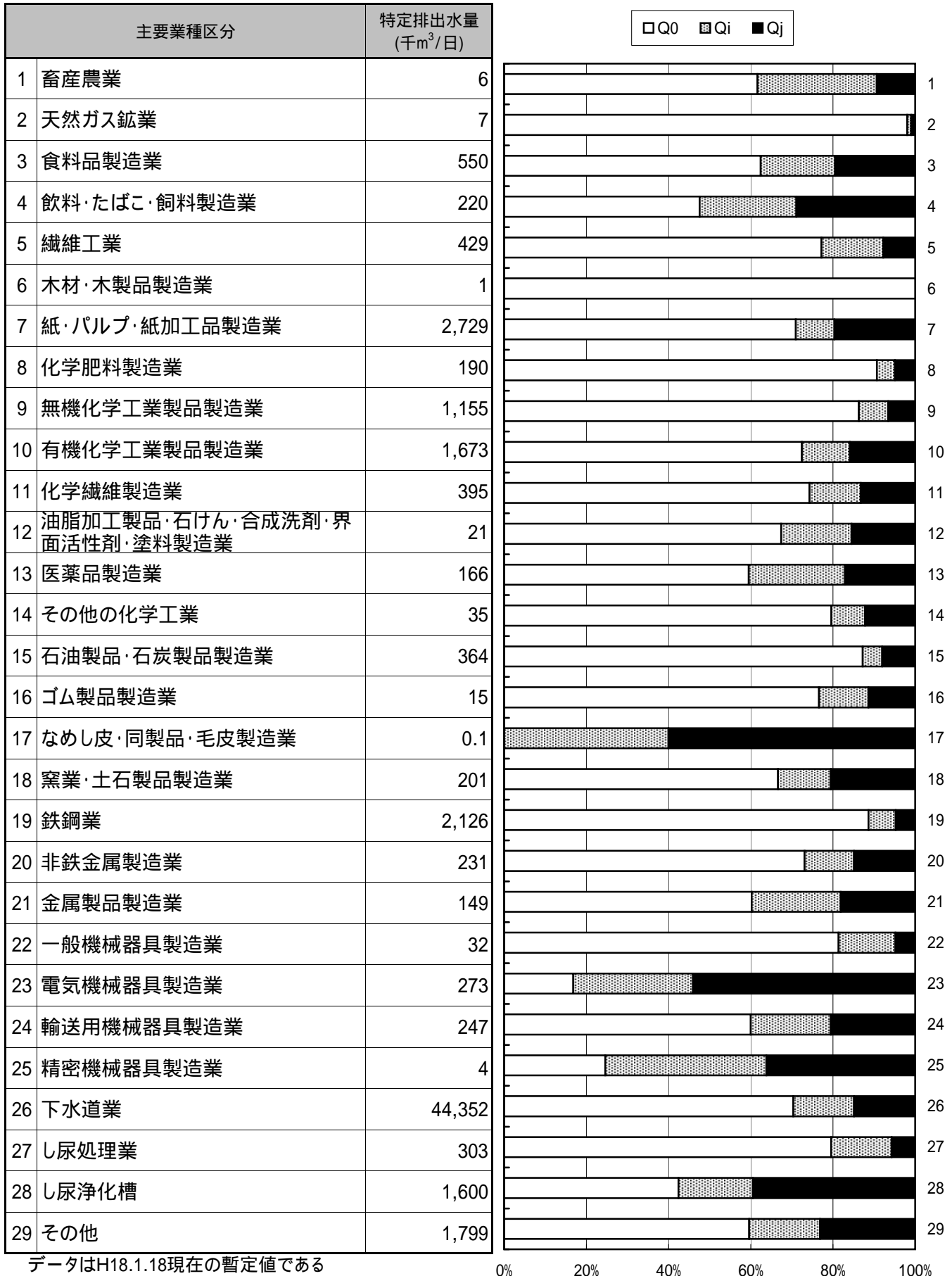
図1 3 海域計 - COD

主要業種等区分別に取りまとめた特定排出水の届出最大水量及びその時期区分別の水量比を以下に示す。