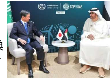
UAE・ジャーベル議長とのバイ会談