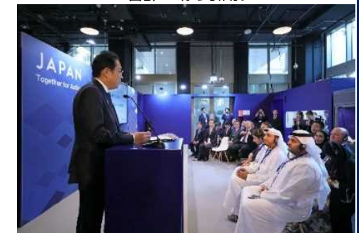
岸田総理がAction to Zero led by Japan and UAEを発信