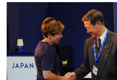
日豪でブルーカーボンイベントを共催