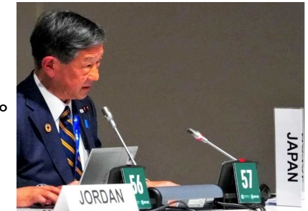
緩和野心閣僚級会合での発言