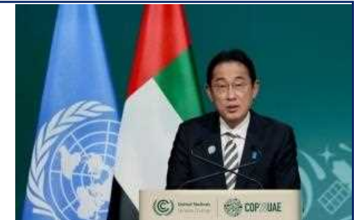
世界気候行動サミットで演説を行う岸田総理