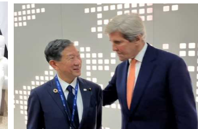
米・ケリー特使との意見交換