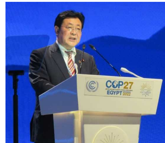
閣僚級セッションで発言を行う西村環境大臣