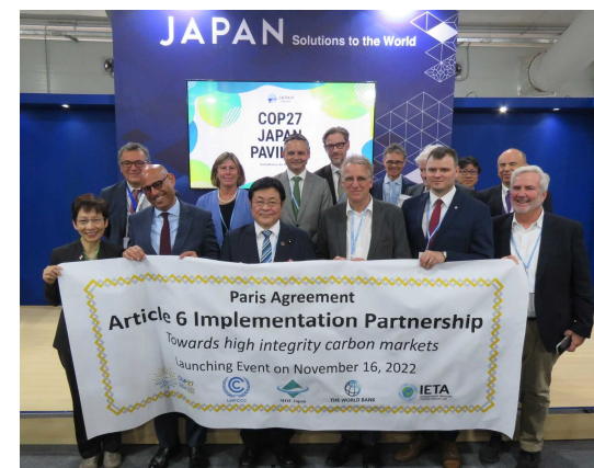
パリ協定6条実施パートナーシップ 立ち上げ式